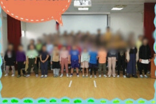
小学部学習発表会

校訓「たくましい子 考える子 思いやりのある子」のもと、お預かりしたお子様を大切に育ててまいります。皆様の高雄日本人学校への越しを心からお待ちしております。