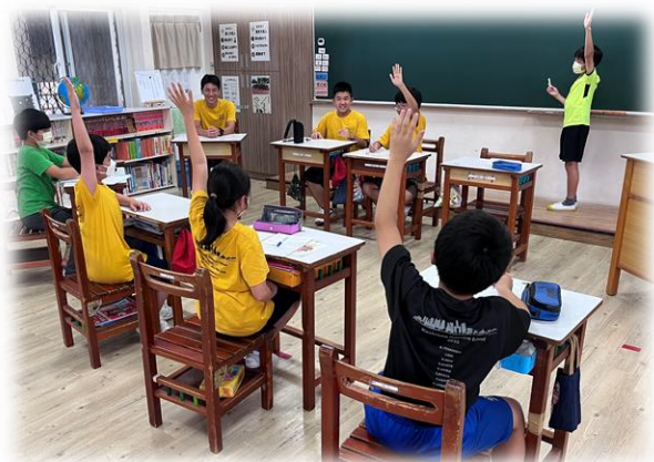
(小学部6年 特別活動)