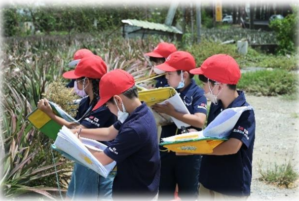
(小学部3年 パイナップル農園見学)