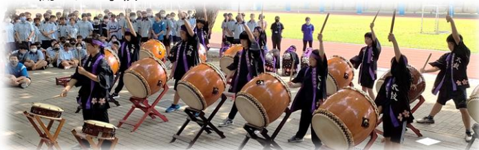
(中学部交流学習 和太鼓披露)