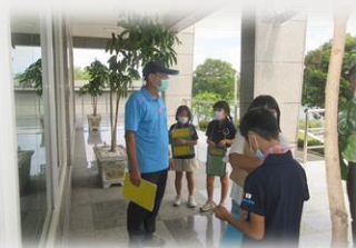
(小学部4年 浄水場見学)

その他にも、学年の学習内容に応じて、社会科見学(スーパーマーケット、農園、浄水場、消防署など)を実施しています。台湾独自の町や公共施設の様子を知ることができ、体験的な学習にも力を入れています。